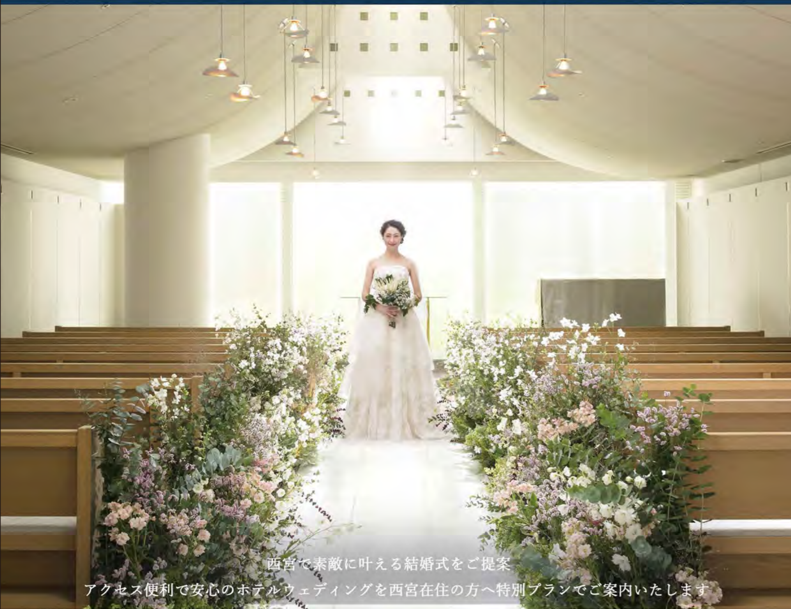
西宮で素敵に叶える結婚式をご提案

アクセス便利で安心のホテルウェディングを西宮在住の方へ特別プランでご案内いたします